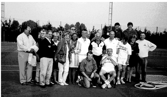
L'équipe D50 championnes nationales en 2004