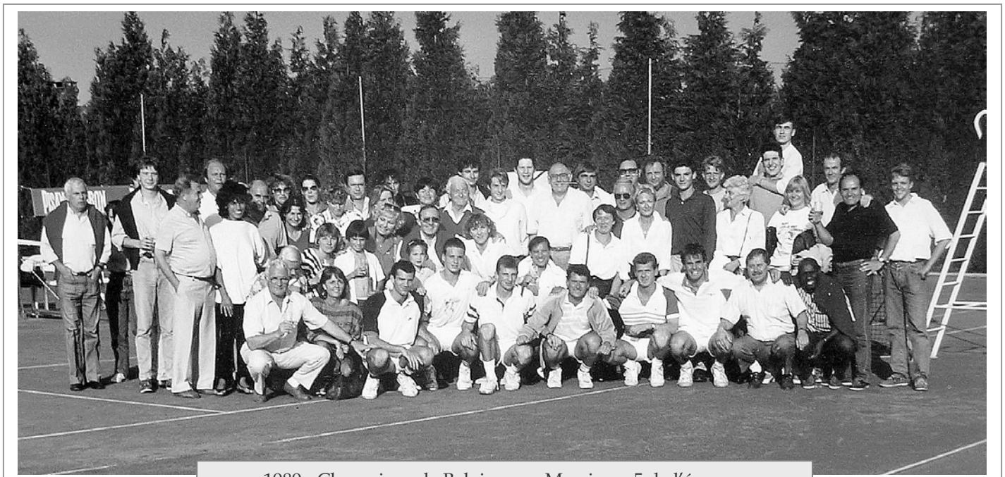
1989 - Champions de Belgique en Messieurs 5 de l'époque L'équipe et quelques supporters....

Il n'empêche qu'ils ont fait notre histoire, tout comme les membres de tous les Comités qui, grâce aux trésors de créativité déployés au fil des ans, de soirées d'ouverture en soirées de clôture, ont organisé matchs-défis, critères, must, tournois des trois saisons (le Salami), box, échelles mobiles, fils rouges, tournois nationaux, tournois intimes, tournois surprises, interclubs d'hiver, rallyes, Olympiades, matchs de foot, de volley, de basket, tournois de cartes, tournois de pétanque ou autres rencontres amicales.